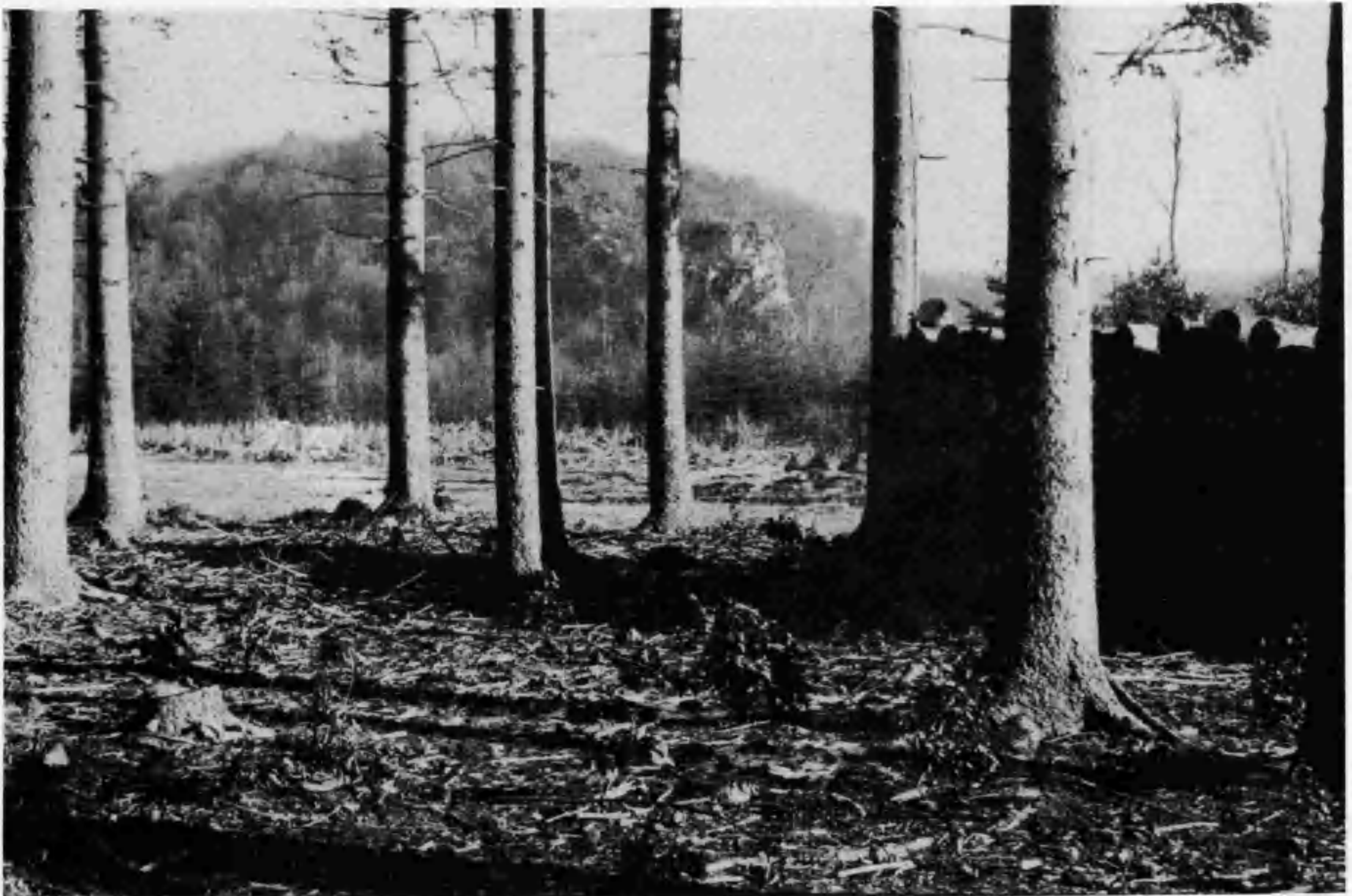
Blick auf die Ruine Schatzberg

Hans IV. von Hornstein stand im Dienst des österreichischen Herzogs Friedrich IV. „mit der leeren Tasche“, blieb ihm auch nach seiner Ächtung 1415 treu und führte für ihn allerlei zweifelhafte Streifzüge aus. Zu Hans IV. kam 1420 der junge Konrad von Hornstein aus Grüningen (ein Sproß der 1388 von Bittelschieß nach Grüningen verzogenen zweiten Linie), der – ein gelehriger Schüler – 1434 mit Lutz von Landau (einem Nachkommen der Grafen von Landau) einen Raubüberfall ausführte. Als Lohn für seine Dienste erhielt Hans IV. von Herzog Friedrich