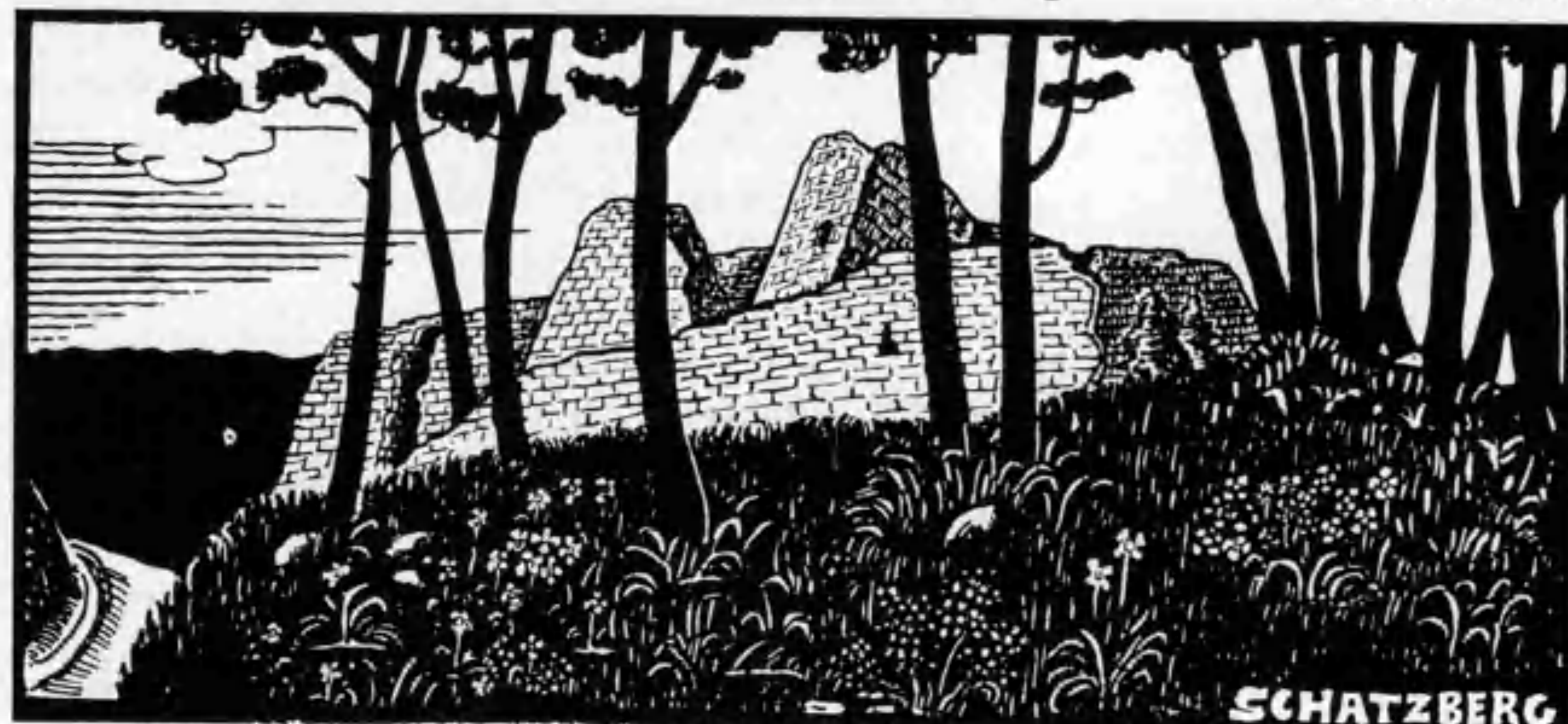
Ruine Schatzberg, 1900 nach der Natur aufgenommen