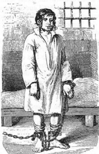
Xaver Hofensteiter, der schwarze Verri im Gefängnisse.