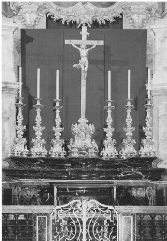
Abb. 2: Hochaltargarnitur, um 1755 bis 1756. Dresden, Katholische Hofkirche.