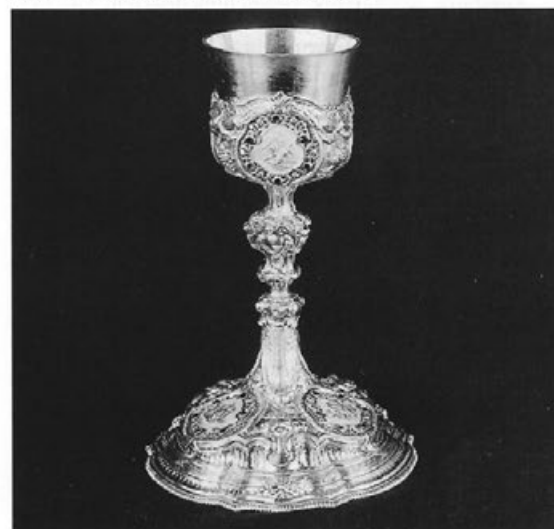
Abb. 11: Kelch mit Perlmuttermedaillons, um 1777 bis 1779. Bad Schussenried, St. Magnus.