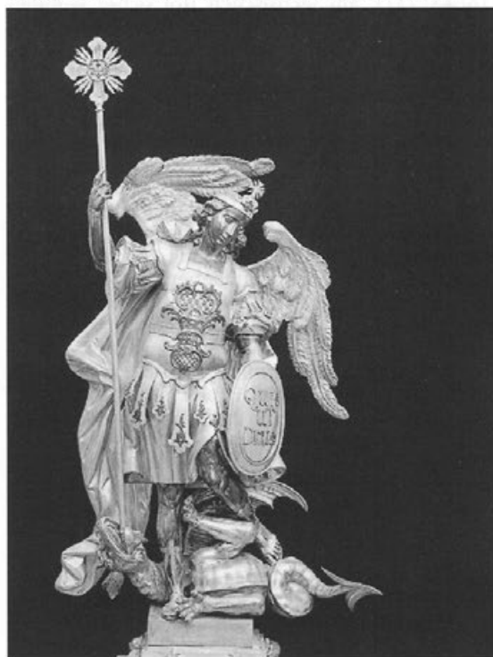
Abb. 6: Hl. Michael, um 1769 bis 1771. Salem, ehemalige Zisterzienser-Reichsabteikirche Mariae Himmelfahrt.