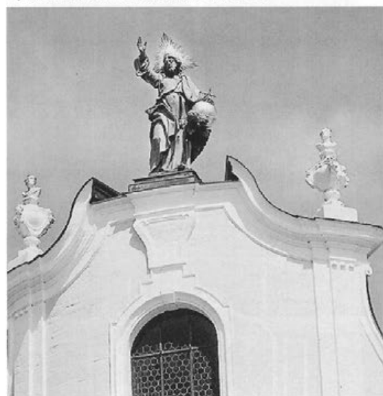
Abb. 4: Salvator auf dem Westgiebel der ehemaligen Reichsabteikirche Ochsenhausen, 1760.

Offensichtlich liegen auch den für seine Heimatstadt Biberach in Silber gegossenen, lebhaft bewegten Putten der St.-Martins-Kirche (um 1765–1767, Abb. 5), die rechts und links am Tabernakel befestigt wurden, Modelle der Verhelst-Werkstatt zugrunde, vergleicht man sie mit den gleichzeitig ent-