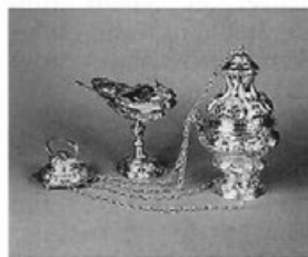
Abb. 9: Weihrauchfaß mit Schiffchen, um 1775 bis 1777. Bad Buchau, Stiftsmuseum.

ben. Beim Umbau der Stiftskirche für das adelige Damenstift in Buchau (1773–1776) durch d'Ixnard war Baur zur Neuausstattung des Altars herangezogen worden, für den er ein neues Altarkreuz (Abb. 8), zwei Steckleuchter und drei Kanontafeln im klassizistischen Stil lieferte. Deutlich unterscheiden sich der strenge klare Aufbau und die Ornamentik des sogenannten Zopfstils von dem nur wenig früher durch Baur dorthin gelieferten Rauchfaß samt Schiffchen in reichen Rocailleformen (Abb. 9). Auch bei dem durch frühklassizistische Elemente bestimmten Silberaltar im Konstanzer Münster (um 1774) waren d'Ixnard und Baur gleichzeitig tätig.