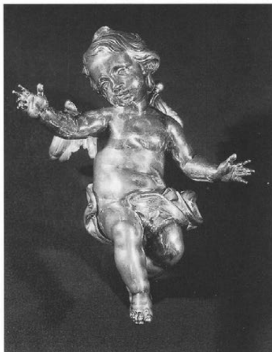
Abb. 5: Zwei Tabernakelengel, um 1765 bis 1767. Biberach an der Riß, St. Martin.

standenen Putten an den von Ignaz Wilhelm Verhelst gearbeiteten Altären der Meersburger Seminarkapelle. 16 In Zusammenarbeit mit der Verhelst-Werkstatt sind darüber hinaus das Kreuz für den Altar der Seminarkapelle in Meersburg (heute St. Peter/Schwarzwald, 1755), die Leuchterengel in Meersburg, St. Mariae Heimsuchung (um 1765–1767), die Immaculata in Ettlingen (1766), die Statue des hl. Michael in Salem (um 1769–1771, Abb. 6) oder die heute in Rom, Collegio Armeno, befindliche Kreuzigungsgruppe (um 1779–1781) entstanden.