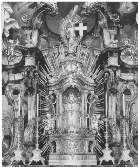
Abb. 3: Hochaltartabernakel, um 1763 bis 1765. Otto- beuren, Benediktinerabtei.