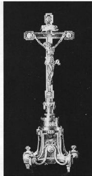
Abb. 8: Altarkreuz, um 1777 bis 1779. Bad Buchau, Stiftsmuseum.

ben. Beim Umbau der Stiftskirche für das adelige Damenstift in Buchau (1773–1776) durch d'Ixnard war Baur zur Neuausstattung des Altars herangezogen worden, für den er ein neues Altarkreuz (Abb. 8), zwei Steckleuchter und drei Kanontafeln im klassizistischen Stil lieferte. Deutlich unterscheiden sich der strenge klare Aufbau und die Ornamentik des sogenannten Zopfstils von dem nur wenig früher durch Baur dorthin gelieferten Rauchfaß samt Schiffchen in reichen Rocailleformen (Abb. 9). Auch bei dem durch frühklassizistische Elemente bestimmten Silberaltar im Konstanzer Münster (um 1774) waren d'Ixnard und Baur gleichzeitig tätig.