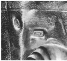
Abb. 1: Meistermarken des Georg Ignatius Baur und Beschauzeichen der Stadt Augsburg mit Jahresbuchstabe Q auf dem Tabernakelrelief des Hochaltars in Ottobeuren, um 1763 bis 1765.

nicht nur die Autorschaft an dem Werk, sondern garantierte damit gleichzeitig auch den in Augsburg vorgeschriebenen, im Vergleich zu anderen Städten relativ hohen Feingehalt von 13lötigem Werksilber. Bevor das Werk zum Verkauf freigegeben wurde, mußte es vom Geschaumeister auf den Silbergehalt geprüft werden und erhielt erst dann das Beschauzeichen, das in Anlehnung an das Augsburger Stadtwappen den Zapfen der Zirbelnuß, den sogenannten Pyr, zeigt. Seit 1734 wurden Jahresbuchstaben auf den Beschauzeichen eingeführt, die zunächst alle zwei Jahre, ab 1799 jährlich wechselten. So sind die Goldschmiedearbeiten, die aus der Werkstatt Baur hervorgegangen sind, auf zwei Jahre genau zeitlich einzuordnen.