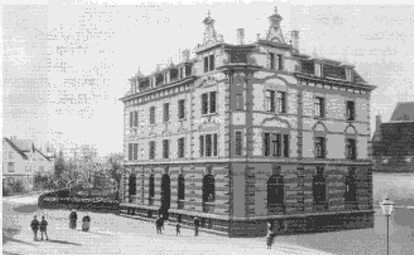
4 Mal Kreissparkasse Biberach: 1853, 1901, 1936 und 1973.

ges hatte die Reichsbank durch mehrere Maßnahmen versucht, die finanzielle Kriegsbereitschaft des Deutschen Reiches zu stärken. Am 30. Juni 1914 beschloss der Biberacher Bezirksrat auf Wunsch der Reichsbank, den gesamten Bestand der Oberamtssparkasse an Inhaberpapieren bei der Reichsbank gegen Pfandschein zu hinterlegen und durch Aufnahme eines Lombarddarlehens von 500 Mark in ein Schuldverhältnis zur Reichsbank zu treten. Damit sollte die finanzielle Kriegsbereitschaft der Sparkasse gestärkt werden. 4 Vorbeugend kaufte die Sparkasse ferner bereits direkt nach Kriegsausbruch für 50 000 Mark deutsche Kriegsanleihen. Patriotische Gefühle mögen