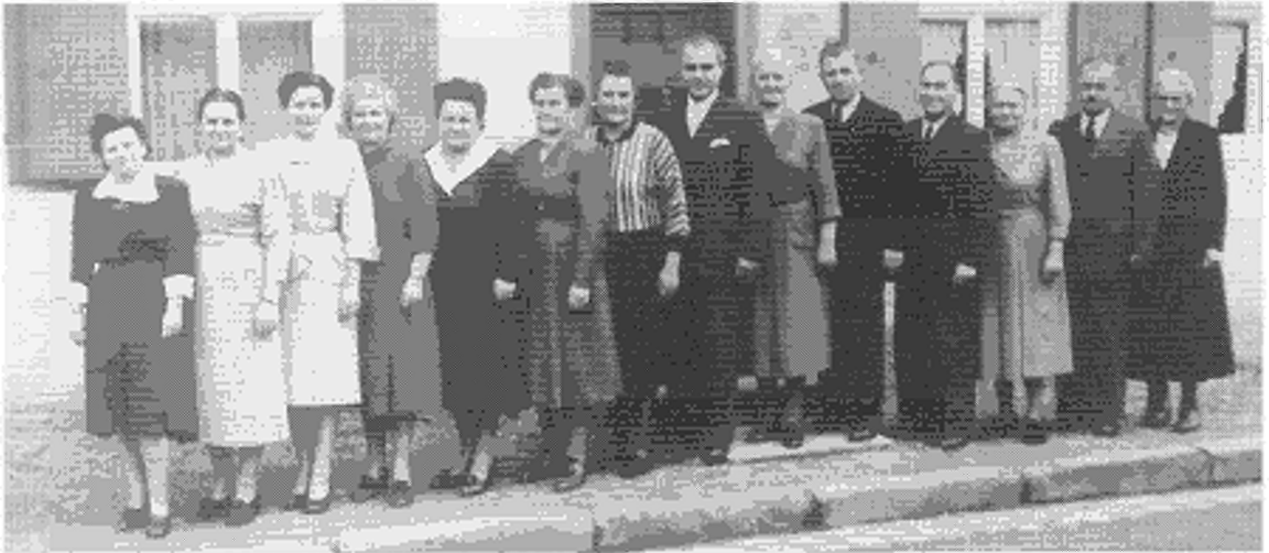
Kinder werden erwachsen: Nach dem Tod der Eltern posieren die Schöffold'schen Kinder letztmals vor dem Elternhaus.

Verkäuferin oder Hausangestellte. Die Frauen sollten weiterhin hauptsächlich die Rolle der Mutter und Hausfrau ausfüllen, die sie nach ihrer Heirat erwartete. Die größten Erfolge erreichte die Frauenbewegung eigentlich nach dem Ersten Weltkrieg: 1918 wurde im Deutschen Reich das Frauenwahlrecht eingeführt. 1919 gingen fast 80 % aller wahlberechtigten Frauen zur Wahl, danach stellten sie 8,5 % der Abgeordneten in der Nationalversammlung und zwischen 5 % und 10 % in den Länderparlamenten. Zwischen 1919 und 1933 saßen 111 Frauen im Reichstag. Dennoch blieben die Parteispitzen meist zu über 90 % in männlichen Händen, was sich lange nicht änderte. Erst am 18. Juli 1957 wurde mit der Ausführung der Artikel 3 und 117 des Grundgesetzes die Gleichberechtigung der Frau auf bürgerlich-rechtlichem Gebiet hergestellt!