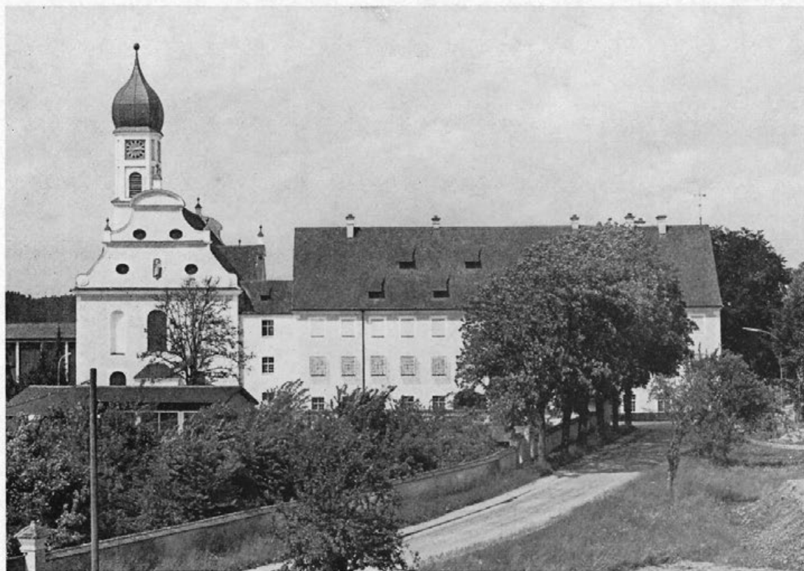
Die Tannheimer Pfarrkirche St. Martin mit dem Gräflich von Schaesberg'schen Schloß, dem früheren Pflegschloß der Benediktiner-Reichsabtei Ochsenhausen.

— der Altar über der Sakristei in der Ehre der Hll. Anna, Andreas, Joachim und Benedikt mit Reliquien der Hll. Johannes d. T., Walburga, Innozenz, Maximus und Emerentiana.