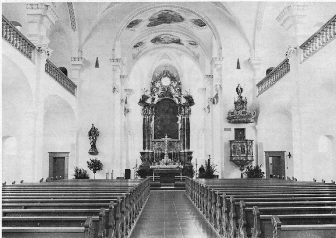
Innere der Tannheimer Pfarrkirche St. Martin

sie „eine fast wortgetreue Abschrift“ nennen konnte, die sich nicht nur im Grundriß, sondern auch im Aufriß streng an das Tannheimer Vorbild hält. Und wenn auch die ursprüngliche Erscheinung der Tannheimer Pfarrkirche durch spätere Eingriffe — 1876 wurden so die beiden barocken Seitenaltäre entfernt und durch neue ersetzt — gelitten hat, so vermag sie allein durch die Wirkung des Raumes immer noch zu beeindrucken. Sie verdient es, unter die bedeutendsten Kirchenbauten des Landkreises Biberach gezählt zu werden.