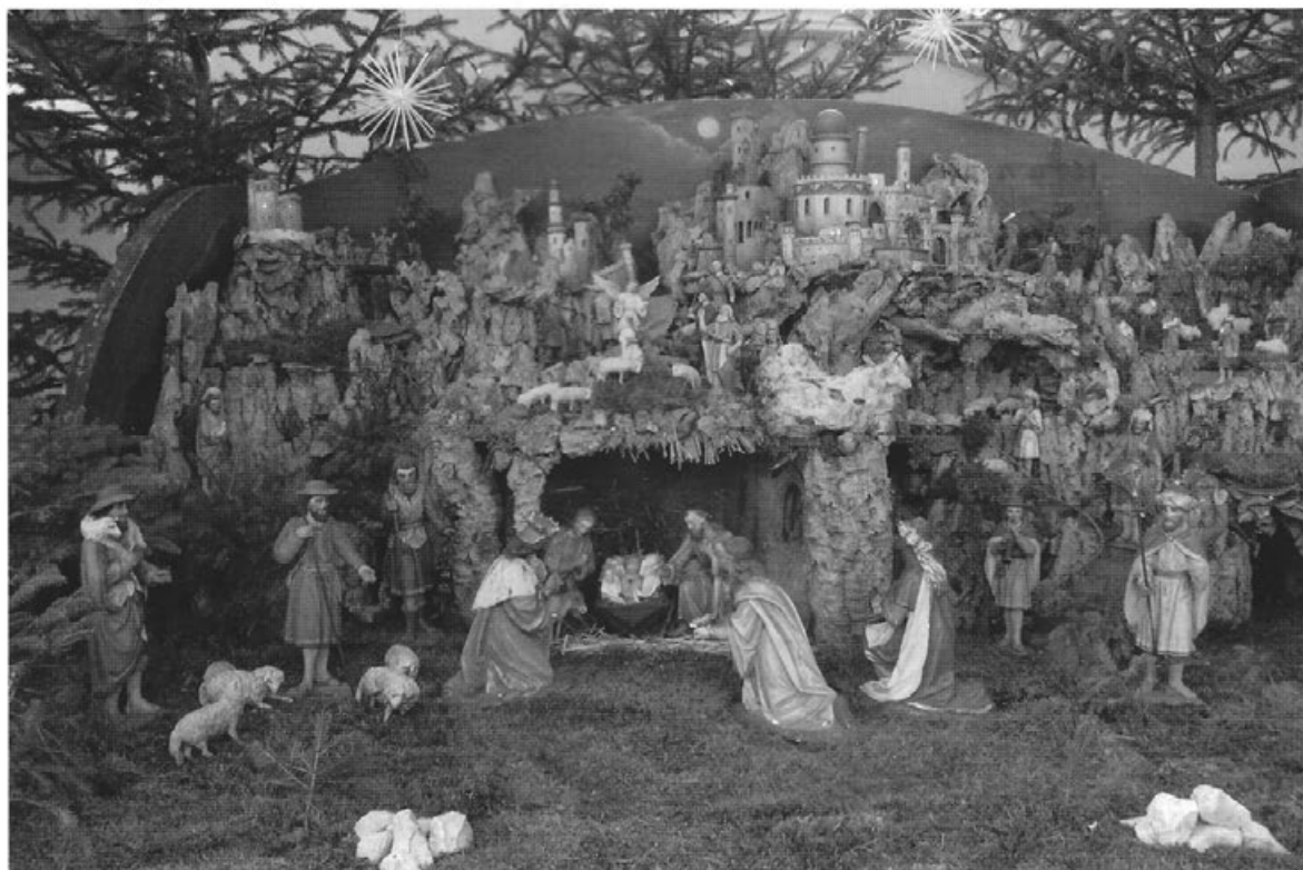
Weihnatskrippe aus der Pfarrkirche St. Georg in Ochsenhausen. Holz, Rinde, Karton und Stroh, um 1900, die Figuren aus Gips und Holz.