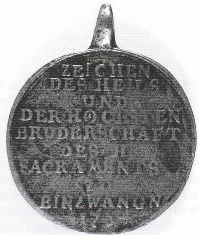
Vorderseite und Rückseite der Medaille der Sakramentsbruderschaft Binzwangen von 1753 und Prozessionsfahne der Sakramentsbruderschaft Binzwangen aus der Zeit um 1750 mit der Darstellung der Gründungslegende.

Grafen von Landau gestiftet und erbaut wurde... Diese Kapelle liegt 300 Schritte südlich vom Dorf, jenseits der Donau an den Grenzen des Breitrieds am Wege nach Ertingen und Herbertingen zu ebener Erde. Sie ist mittelmäßig hell, mit einem Hochaltar und 2 Nebentären versehen; sie hat eine Kanzel zum Predigen, eine Emporkirche (Empore) mit Knie- und Sitzbänken, auch dergleichen Gebetstühle im Langhaus, im Chor 2 Chorstühle links und rechts mit Knie- und Sitzbänken. Die Länge des Langhauses ist 46 Fuß (13 m), die Breite 25 Fuß (7 m). Auf jeder Seite sind elf 10 Fuß lange Betstühle. Auch die Emporkirche ist mit Knie- und Sitzbänken versehen für 60 Personen. Außer diesen Betstühlen hätten noch zwischen den Nebentären etwa 50 Personen Platz zum Stehen. Abgesonderte Oratorien oder unterirdische Gewölbe sind nicht, auch ist keine Orgel vorhanden. Diese Kapelle befindet sich im schlechtesten Zustande und kann kaum je wieder hergestellt werden. Die Baulast hat die Kirchenpflege.“