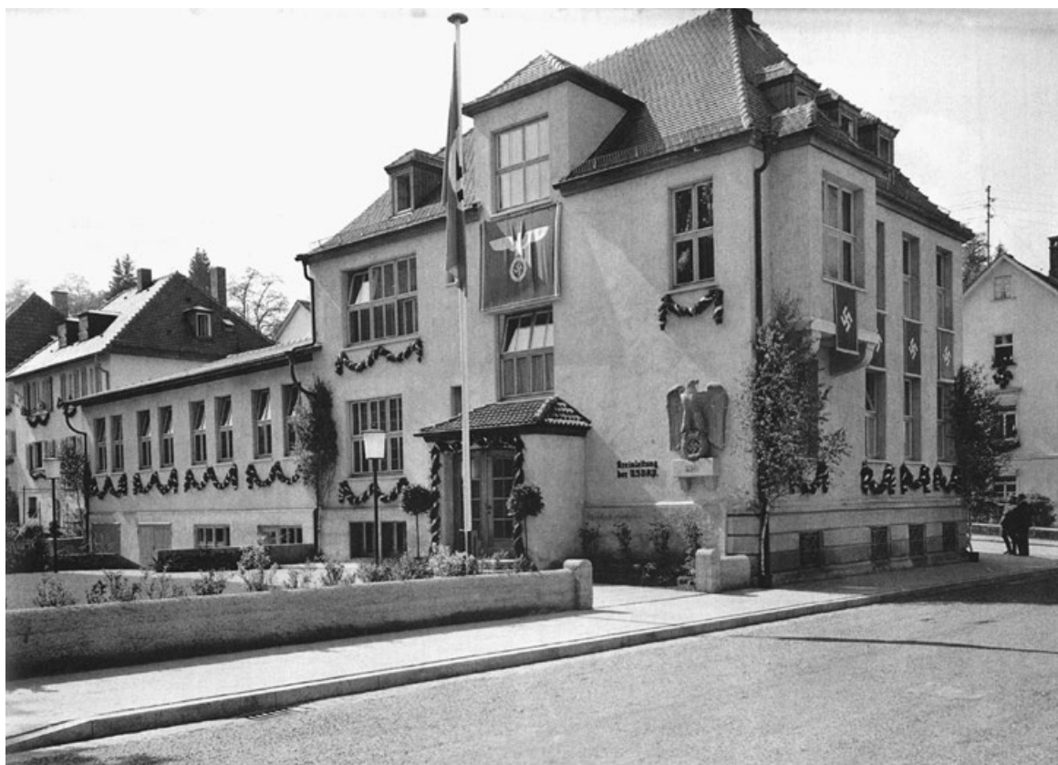
Das Pestalozzihaus als Haus der NSDAP-Kreisleitung 1939.

ein dreiviertel Jahrhundert lang, von 1946 bis heute, ein Ort und Hort der Biberacher Kultur. In kaum einem Gebäude der Stadt bündelt sich eine solche kulturelle und historische Vielfalt.