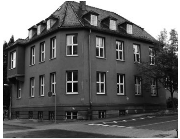
Das Pestalozzihaus heute.

Aber es verschwand in Biberach eben auch einiges an historischer Bausubstanz, nur weil Zeitgeist und Fortschritt als Fetisch missverstanden wurden. Nachfolgebauten und Nachfolgelücken (letztere besonders schmerzlich) stellten sich meist als Verschlimmbesserungen heraus. Die landläufige Meinung, „ma dät's heit nemme so macha,“ hat sich nie richtig durchgesetzt. Das zeigt sich jetzt wieder am Pestalozzihaus, das nach einem länger dauernden Vorgrummeln in den ungemütlichen Platz des Widerstreits zwischen Contra und Pro hineingeraten ist und Angst um seinen Fortbestand haben muss – ähnlich, wie das Kind im Kaukasischen Kreidekreis.