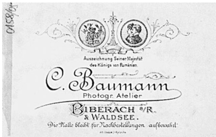
Visitenkarte des rumänischen Hoffotografen C. Baumann.

Das Baumansche Haus gehört also in einen ganzheitlichen Zusammenhang und steht nicht zufällig in der Weltgeschichte herum. Es hat einen engen Bezug zur Biberacher Stadtentwicklung, auch durch die ursprünglich äußerst zierreiche und für den stolzen Bauherrn kostspielige Gestaltung in einem Neo-Klassik-Stilmix mit Spitzhelmtürmchen, Ziergiebelerker und verschwenderischen Fenster-„Kleidern“. Entlang der Mondstraße gab es sogar ein Mini-Barockgärtchen: Repräsentanz de luxe. Häuser machen Leute: voila, das Baumansche „Schlösschen“.