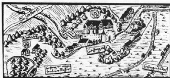
Schloß Göppingen nach der Landkarte von 1589