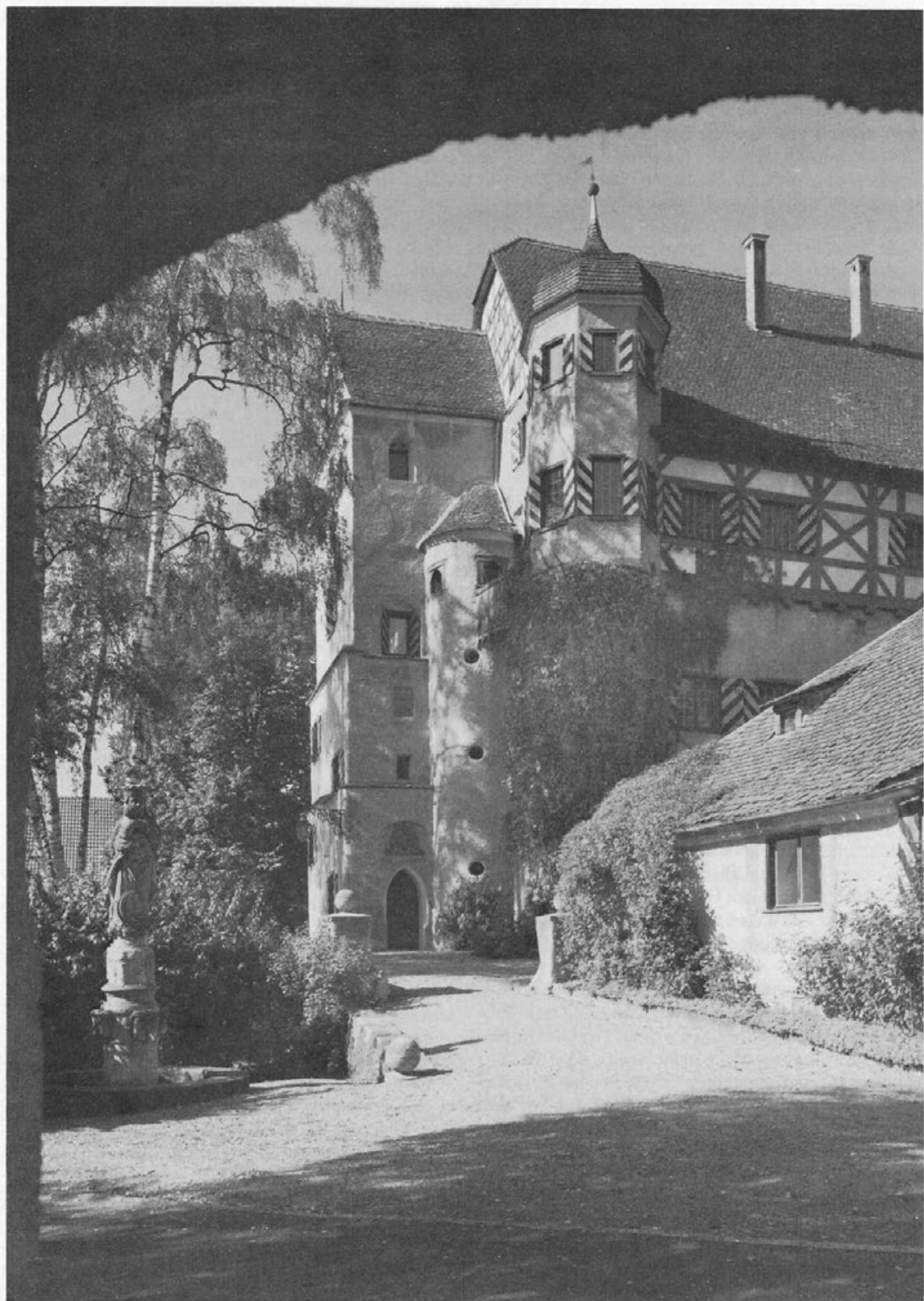
Schloß Grüningen heute