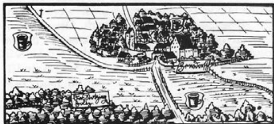
Schloß Heudorf nach der Landkarte von 1589