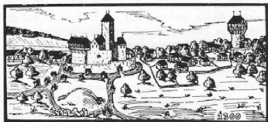
Burg Grüningen, nach den noch vorhandenen Grundmauern rekonstruiert