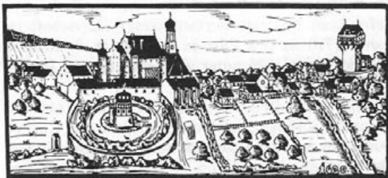
Schloß Grüningen vor dem 30jährigen Krieg nach einem alten Ölgemälde im Schloß daselbst