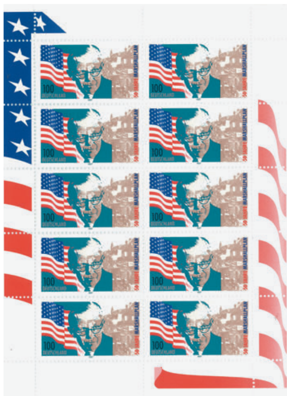
Gestaltung eines Zehnerbriefmarkenblocks der Deutschen Post. 9. Juni 1997.

wie bspw. zum Biberacher Schützenfest 2016. Dem Programmbeirat gehören drei Bundestagsmitglieder, ein Vertreter des Deutschen Presserats, ein ständiger Vertreter der Konferenz der Kultusminister der Länder, ein Vertreter des Bundes Deutscher Philatelisten sowie ein Vertreter des Bundesfinanzministeriums an. Auch damit sollen Relevanz und Vielfalt der Themen gewährleistet werden.