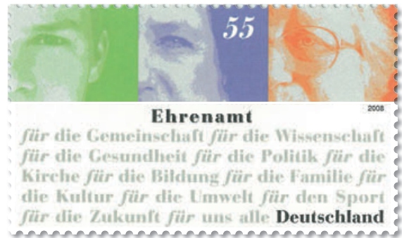
Briefmarke vom 12. Juni 2008.

Deutsche Briefmarken geben im Unterschied zu Briefmarken anderer Länder häufig ein politisches Statement ab. Dies ist gewollt. Die Themen müssen einen Bezug zu Deutschland haben und sie müssen von nationaler Bedeutung sein. Sie informieren über unser Land und seine Geschichte und dienen damit der Erinnerung. Mit den „Wohlfahrtsmarken“, ebenfalls Sondermarken, werden viele Millionen Euro für soziale Zwecke eingesammelt und verteilt. Die Themen dürfen nicht parteipolitisch spezifisch sein und keinen kommerziellen Interessen dienen. Und Briefmarken werden keinen lebenden Personen gewidmet, seien sie auch noch so prominent. Deshalb bekommt Bundeskanzlerin Angela Merkel noch keine