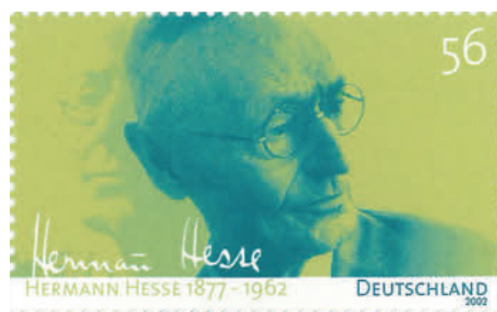
Briefmarke vom 4. Juli 2002

men sie das Angebot eines Grafikbüros in Riedlingen an und ziehen von München nach Oberschwaben. 1987 machen sie sich als „team rogger“ in Riedlingen selbstständig, 1990 verlegen sie das Büro nach Biberach. 1987, 1990 und 1991 werden ihre Kinder geboren. „team rogger“ etabliert sich im expandierenden Bereich der Printmedien. In den folgenden Jahren halten Grafikprogramme Einzug in die Gestaltungsbüros und verändern die Tätigkeit und das Berufsbild grundlegend. Innerhalb weniger Jahre sind fast alle handwerklichen Erfahrungen obsolet – scribbeln, kleben, zeichnen, airbrushen werden von der digitalen Technik per Mausklick übernommen. Gestalterische Fragen werden immer stärker zu einer Frage der Beherrschung von Grafikprogrammen. Auch für das Entwerfen von Briefmarken. Corinna Rogger vollzieht die technischen Veränderungen mit und erhält Einladungen für neue Wettbewerbe. Sie ist ehrenamtlich tätig, bspw. viele Jahre lang als Elternbeiratsvorsitzende des Wielandgymnasiums. 1996 beginnt sie an der Jugendkunstschule Biberach zu unterrichten, wo sie von 2001–2012 die Fachbereichsleitung innehat. 2009 trennt sich das Ehepaar, betreiben aber weiterhin gemeinsam das Grafikbüro. 2016 heiratet sie Marcel Dintheer. 1