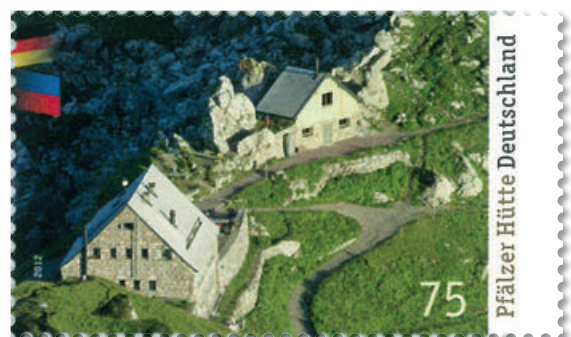
Briefmarke vom 14. Juni 2012.

Der politische Wille für die Herausgabe einer Briefmarke wird den teilnehmenden Büros bei der Ausschreibung erläutert. Dafür steht dem Finanzministerium ein Programmbeirat zur Seite, der Themen und Motivvorschläge sammelt. Alle Einwohner dieses Landes dürfen Vorschläge einreichen. Dabei müssen die Themen von einer Bedeutung für die Allgemeinheit sein. Lokal oder regional herausragende Anlässe reichen nicht aus, weshalb das Biberacher Schützenfest die Voraussetzung für eine Sondermarke nicht erfüllt. Hingegen können private Zustelldienste wie „südmail“ eigene Briefmarken zu eigenen Themen herausgeben,