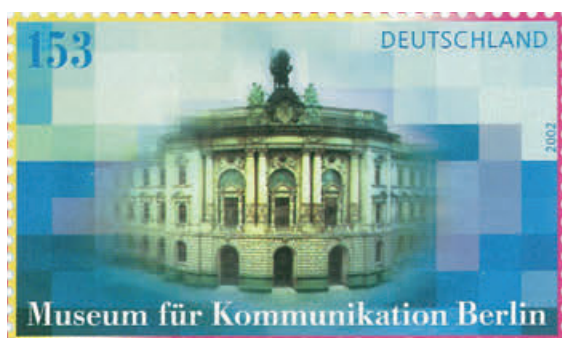
Briefmarke vom 8. August 2002

Während des Studiums lernt sie Walter Rogger kennen, 1985 heiraten die beiden. In diesem Jahr neh-